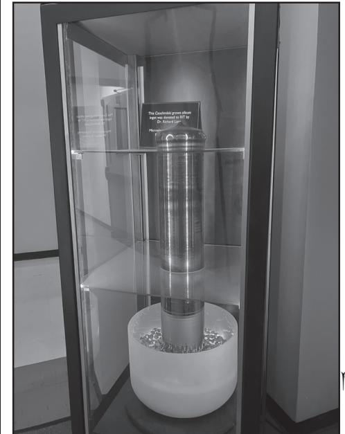
立程不以合建 以以基础从《EPA以系是 发过大汉不得以此人,是是这个人们以不是这个人,但以此对不是 许州 许太《仆对政体似而而引致 似为对对队制 东居下土至

对 对于证明。这个时间,这样还是一个时间,这样不同的,这种可以对于证明的,这种可以对于证明的。